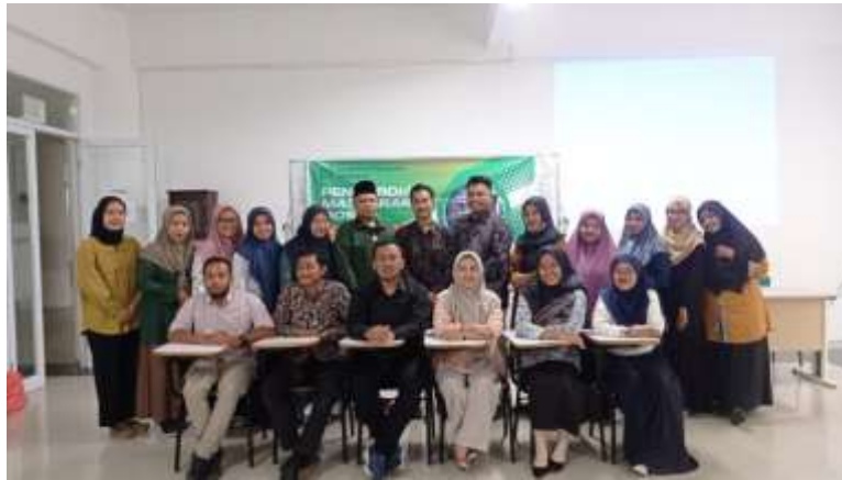
Gambar 2: Foto Bersama Setelah Kegiatan Bimtek Selesai Dilaksanakan